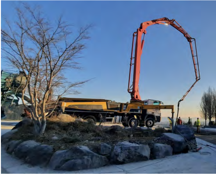
Putzmeister BSF 42-5