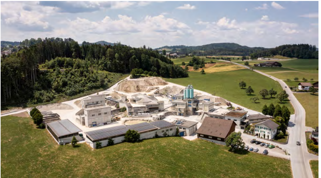
Willi Scherrer Kies und Beton AG, 9602 Bazenheid.

Willi Scherrer, Kies + Beton AG Tel. 071 932 60 10 Wolfikonerstrasse 16 9602 Bazenheid