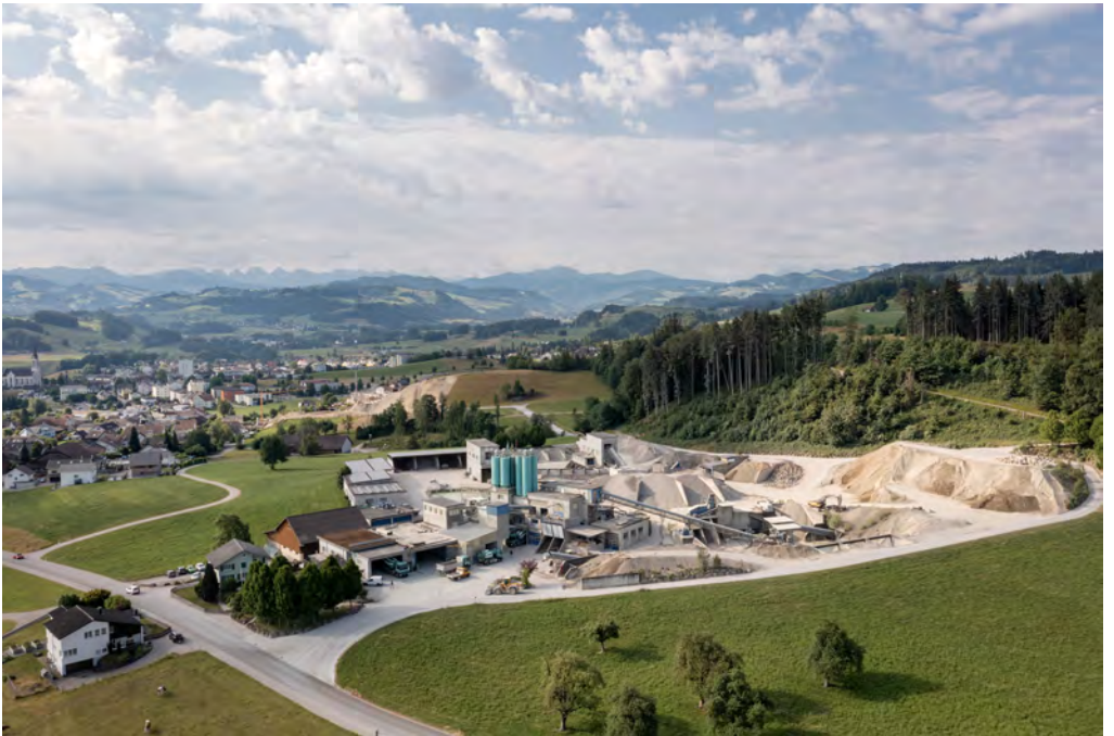
Hinten: Kiesabbaugebiet Chrobüel Mitte: Kies- und Betonwerk