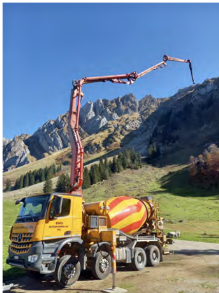
Fahrmischerpumpe Putzmeister 28.4.