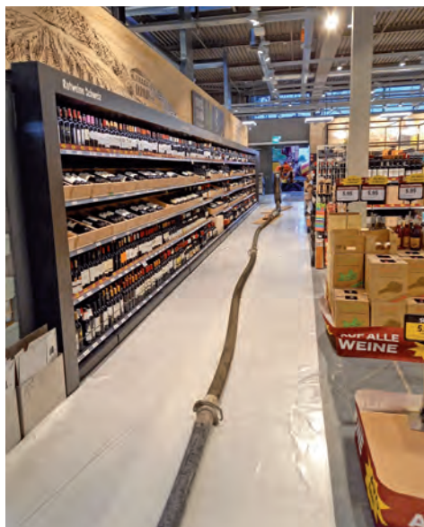
Baustelle Coop Rickenbach Pumpleitung 45 Meter Länge

Für die Einhaltung der einschlägigen Verordnungen der SUVA über die Verhütung von Unfällen bei Bauarbeiten ist der Auftraggeber verantwortlich.